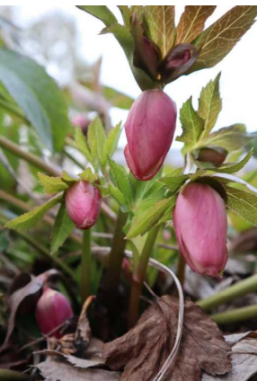
クリスマスローズ 寒い中、2月初めに顔を出していました。嬉しいですね。

○日本語には美しいことばがたくさんありますが、四季を通じて「雨」を表すことばも多いですが、この時季の恵みの「雨」を表すことばは心を温かくしてくれます。