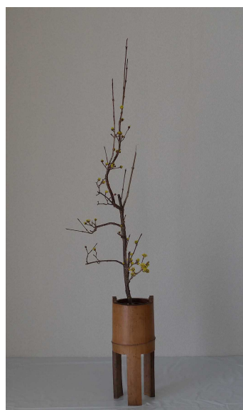
面白い枝を見つけて